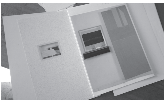
Syberberg pastoralan (dcha) Pelikan Pasolini, 1997 (izda)